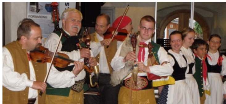
Folklore - Musik- und Tanzvorstellung